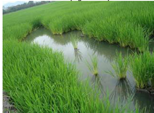
Figura 14. Cultivo de arroz con espacios vacíos provocados por el ataque de P. canaliculata .

Ataca las plantaciones de arroz en su primera fase de crecimiento. Las plántulas de 15 días de trasplantadas son vulnerables al ataque del caracol; así mismo las sembradas por semilla de 4-30 días. Devora la base de las plántulas jóvenes; incluso puede consumir toda la planta en una sola noche. Las hojas cortadas se encuentran en la superficie del agua (Ferguson, 2005). Cuando el daño es severo se observa la presencia de zonas despobladas en el arrozal (figura 14).