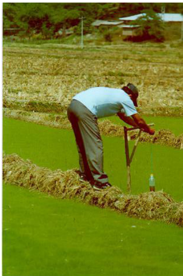
Figura 10. Colocación de trampas a base de fermentos para atrapar insectos voladores diurnos (mariposas, escarabajos, chinches).