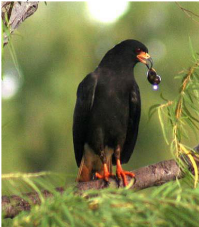
Figura 16. Control de caracol manzana por R. sociabilis .

jugar un rol significativo en la regulación de la población de esta plaga. Quizás el más efectivo predador es el gavilán caracolero ( Rostrhamus sociabilis , Vieillot, 1817) el cual presenta un pico largo, delgado y en forma de gancho adaptado para la extracción de caracoles (figura 16). El halcón caracolero junto a otras aves como patos, gallaretas, actúan como controladores naturales de la plaga, por lo que se recomienda evitar su caza (República del Ecuador. Instituto Nacional de Investigaciones Agropecuarias, 2007).