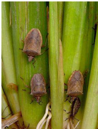
Figura 8. Adultos de T. limbativentris atacando hojas y tallos del arroz.