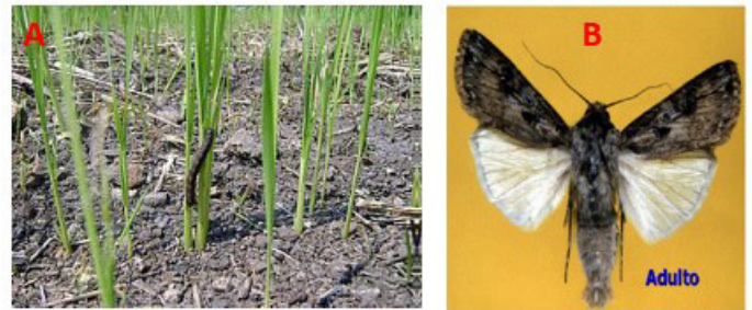
Figura 7. A. Gusano cogollero atacando una plantación joven de arroz. B. Adulto de S. frugiperda .

llegan a causar un impacto negativo cuando la temperatura del ambiente alcanza unos 30°C, las larvas se alimentan de nervaduras, tallos y hasta perforan la planta. En la figura 7 se observa el estado adulto y los daños ocasionados por larvas de S. frugiperda .