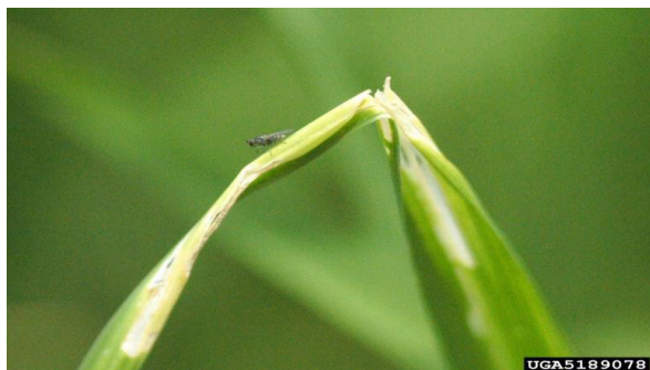
Figura 4. Ataque de la mosca minadora del arroz. Obsérvese la torcedura y la decoloración de la punta de la hoja.

Fuente. República del Ecuador. Instituto Nacional de Investigaciones Agropecuarias (2007).