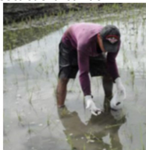
Figura 17. Recolección manual de huevos (izquierda) y adultos (derecha) de P. canaliculata .

Colocación de mallas: se colocan trampas de mallas en las entradas y salidas de agua de los campos de arroz, con lo que se evita que al menos