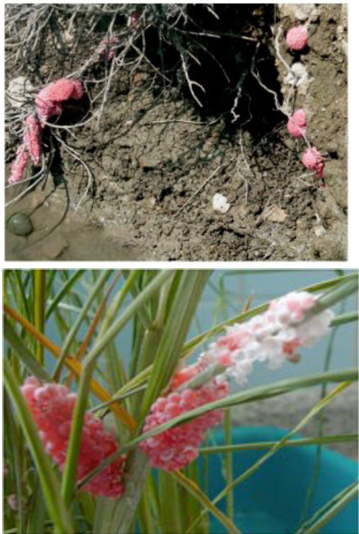
Figura 13. Puesta de huevos del caracol Manzana. Obsérvese que realizan la ovoposición fuera del agua. A la izquierda en raíces de árboles a la derecha en plantas de arroz.

aunque pueden llegar a superar los 2000. Los huevos eclosionan a los 15 días y las crías presentan el mismo aspecto que el adulto, pero con un tamaño de unos pocos milímetros. En dos o tres meses alcanzan la madurez sexual y son capaces de reproducirse (Aragón. Centro de Sanidad y Certificación Vegetal, 2014).