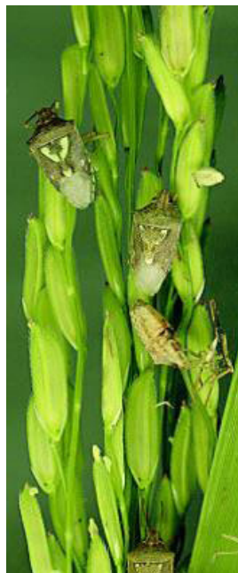
Figura 9. Adultos de chinche vaneadora alimentándose de los granos de arroz en estado lechoso.

Produce daños principalmente en la panícula, y son más específicos en el momento del llenado del grano, los cuales se encuentran suaves y en estado lechoso, lo que facilita que el insecto lo succione mediante el estilete que posee en su aparato bucal. Este daño es ocasionado directamente por el adulto cuando llega a esta etapa de madurez y necesita garantizar su alimentación (República de Cuba. Ministerio de la Informática y las Comunicaciones, 2017a). Vivas & Notz (2009), argumentan que la chinche vaneadora ( Oebalus insularis Stal.) perteneciente al Orden: Hemiptera, familia Pentatomidae, ha llegado a convertirse en una plaga que ocasiona severos daños al cultivo del arroz, al generar pérdidas económicas de un 30 a 65% del valor total de la producción (figura 9).