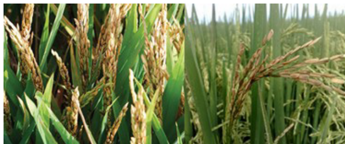
Figura 12. Sintomatología del daño que provoca el ácaro blanco en el cultivo del arroz.

Los daños pueden ser directos, debido a su alimentación e indirectos por la inyección de toxinas o la diseminación de organismos fitopatógenos. El ácaro produce un cuadro sintomatológico complejo por su vinculación con el hongo Sarocladium oryzae . Se encuentra en el interior de las vainas de las hojas de arroz en poblaciones elevadas y provoca la pudrición de la vaina (Celi & Quiroz, 2015); además puede encontrarse en asociación con la bacteria Burkholderia glumae , conocida de forma vulgar como Añublo bacterial de la panícula del arroz (figura 12).