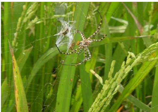
Figura 11. Adulto de Oebalus insularis capturado por una especie de araña.

Otra forma de control efectivo es por medio de controles biológicos como especies de arañas (figura 11) y el hongo entomopatógeno Metarhizium anisopliae (República de Cuba. Ministerio de la Informática y las Comunicaciones, 2017).