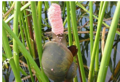
Figura 15. Caracol manzana adulto, puesta de huevos y hojas amarillentas del arroz debido a los daños producidos por la plaga.

Se alimenta de plantas de arroz tiernas, especialmente las de siembra directa y de trasplante temprano, que son las más susceptibles. Las hojas consumidas por esta plaga son cortadas, muestran un color amarillento (República del Ecuador. Instituto Nacional de Investigaciones Agropecuarias, 2007). En la figura 15 se muestra un caracol adulto en su ataque a las hojas, las cuales exhiben un color amarillento y la puesta de huevos de color rosado.