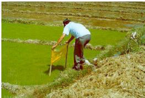
Figura 6. Trampas a base de colores y pegante para atrapar insectos pequeños como Hydrellia sp.

Control etológico: consiste en la utilización de trampas activadas con atrayentes lumínicos, visuales (colores), alimentarios (fermentos), sexuales (feromonas), que actúan como estímulos para atraer a los insectos plaga a fin de atraparlos. Las trampas a base de luz atraen a insectos voladores nocturnos (mariposas, escarabajos, moscas). Al capturar a los insectos adultos se interrumpe el ciclo biológico de éstos y se logra la disminución de sus poblaciones. Se recomienda colocar entre 6 a 12 trampas por hectárea (figura 6). Las trampas a base de colores y pegantes atrapan insectos pequeños, tales como mosquillas y uruzungos ( Thrips ). El color amarillo atrae mosquillas, mientras que el color azul atrae a los uruzungos. Como pegante se puede utilizar aceite de comer, manteca de cerdo diluida o un pegante sintético de la agroindustria conocido como biotac (Suquilanda, 2003). Las trampas se utilizan con el objetivo de atraer insectos para eliminarlos y disminuir las poblaciones, monitorear la incidencia de la plaga y determinar las especies de insectos presentes en el cultivo.