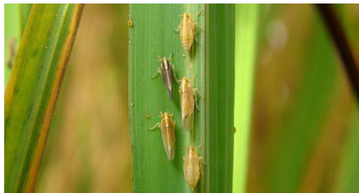
Figura 1. Adultos del insecto sogata alimentándose de las hojas del arroz.

Dentro de las plantas de arroz el virus tiene como promedio un periodo de incubación entre los 7 a 14 días, periodo en que se observan los síntomas y no es posible su control (República Bolivariana de Venezuela. Asociación de Productores de Semillas Certificadas de los Llanos Occidentales, 2017). Morales & Jennings (2010), afirman que la transmisión del RHBV a la planta es causada por la plaga cuando se alimenta de las hojas de la planta enferma y después pica en plantas sanas (figura 1).