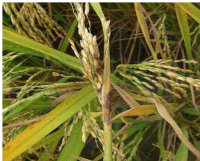
Figura 2. Síntomas de S. oryzae en el cultivo del arroz.

El síntoma más característico de S. oryzae se presenta en las hojas superiores enfocándose sobre todo en la hoja bandera, estas lesiones presentan una coloración gris en el centro y hacia el exterior de color café, de forma ovalada, a medida que la enfermedad progresa, los daños se alargan y colisionan. Cuando la infección aparece en una etapa temprana de desarrollo y de una forma severa, la panícula no emerge, o lo hace parcialmente y en ocasiones se pudre (Figura 2). Otros de los síntomas característicos asociado a esta enfermedad es la esterilidad y vaneamiento de los granos (República del Ecuador. Instituto Nacional de Investigaciones Agropecuarias, 2007).