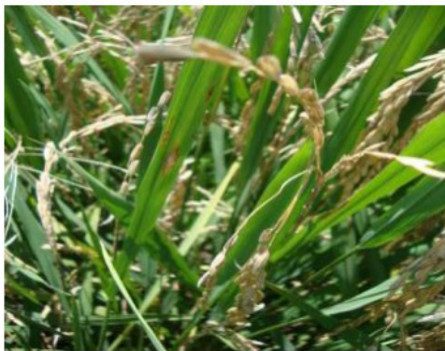
Figura 1. Daños producidos por P. oryzae en el cultivo del arroz.

Desafortunadamente no se ha cuantificado los daños ocasionados por la enfermedad en el Ecuador, a pesar de ser una de la más importante en este cultivo. Este hongo transmitido vía semilla, puede presentar una incidencia de hasta 66,6% (Malavolta, 2007). Es una enfermedad que se encuentra relacionada con los días lluviosos, lo cual, desde el punto de vista epidemiológico, favorece su incidencia en arrozales (Cárdenas, et al., 2010), ocurriendo este clima peculiar en el Trópico húmedo ecuatoriano. En la Figura 1 se aprecian los daños que presenta la planta de arroz afectada por P. oryzae .