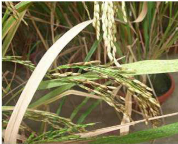
Figura 3. Granos de arroz afectados por complejos de hongos y bacterias.

del grano, ya que se rompen muy fácil durante el proceso de pilado (República del Ecuador. Instituto Nacional de Investigaciones Agropecuarias, 2007).