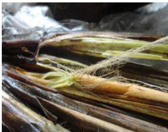
Figura 4. Sintomatología del hongo G. graminis en el arroz.

Las plantas atacadas por la pudrición negra son de menor tamaño, las espigas son blancas, estériles, cloróticas o con vaneamiento en los granos. Los daños son de coloraciones oscuras en los entrenudos y muerte de las vainas foliares, en los tallos afectados por este hongo se observa el signo de la enfermedad, que son puntuaciones de tonalidades oscuras y algo característico es la formación de raíces adventicias (Figura 4). Las raíces alcanzan un tono marrón oscuro a negro brillante con lesiones y secamientos, a veces se confunden con lesiones producidas por sales acumuladas en el suelo (República del Ecuador. Instituto Nacional de Investigaciones Agropecuarias, 2007).