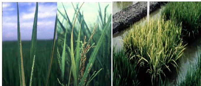
Figura 6. Síntomas del Virus de la Hoja Blanca en panículas y hojas.

Unas de las características más importantes del virus de la hoja blanca son líneas en forma de bandas en posición longitudinal de color blanco, que se encuentran alineadas a la nervadura central de la hoja y pueden exponerse como un mosaico típico (Figura 6).