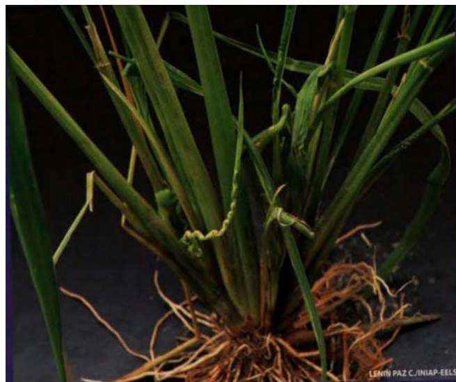
Figura 8 Síntomas del entorchamiento del arroz

tallo. El limbo abierto mostró un rayado clorótico o un bandeado clorótico a lo largo de la nervadura central. Los tallos presentaron un acortamiento en su longitud o un desparramado lateral (Figura 8). Otros síntomas fueron la clorosis y la muerte de la planta, esta última ocasionada por una necrosis del tejido vascular (Paz, et al., 2009).